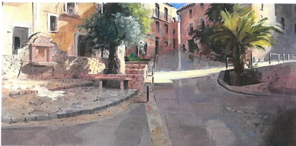
1er PREMI Mercè Humedas Parés