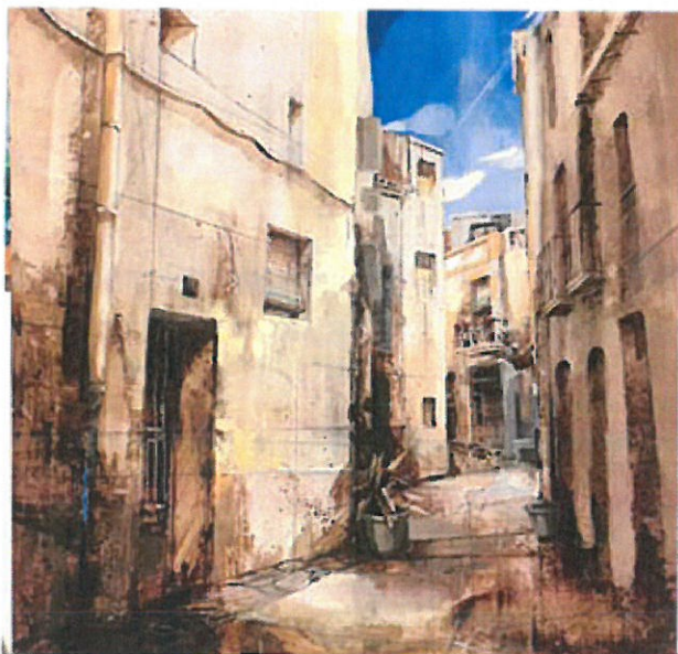
2n PREMI Aida Mauri Crusat